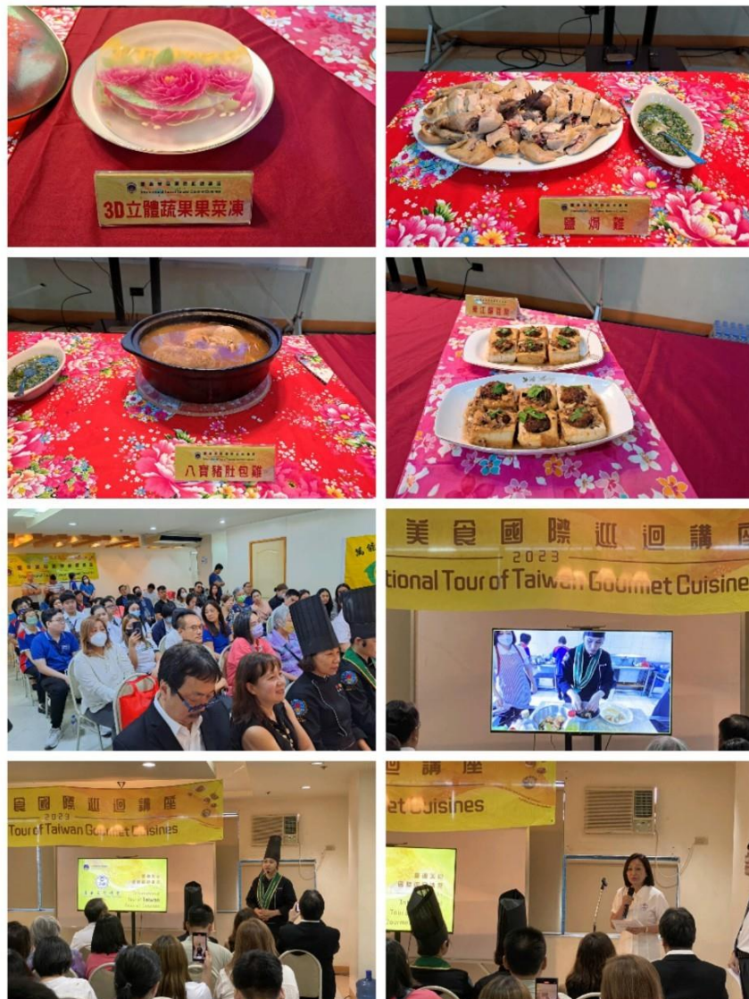
圖說：現場盛況及示範料理