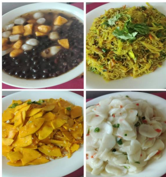
圖說：示範及宴會料理