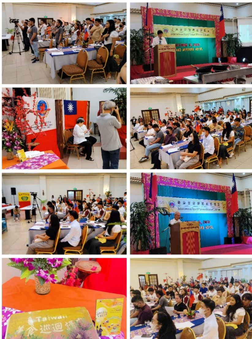
圖說：活動現場及示範料理