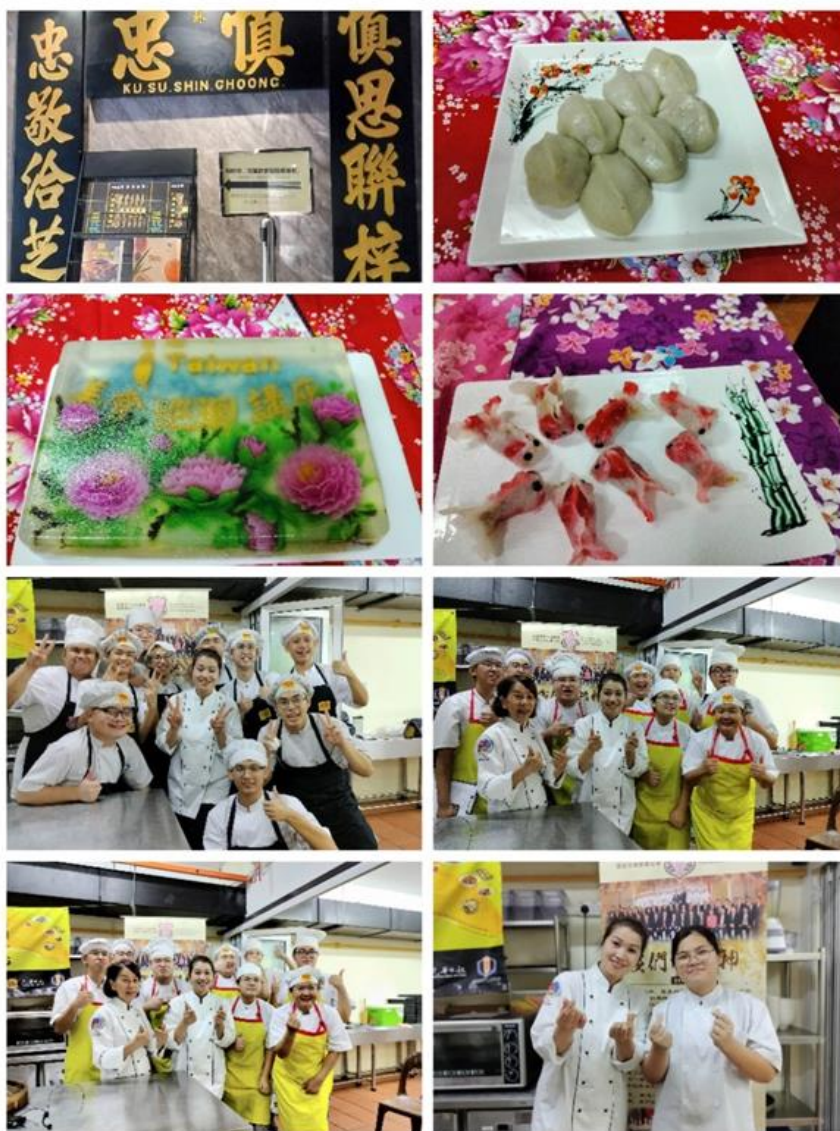
圖說：活動現場及示範料理