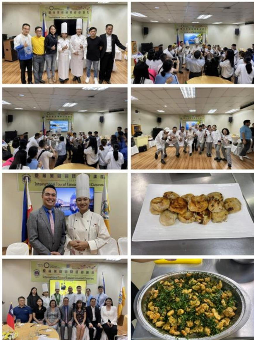
圖說：活動現場及示範料理