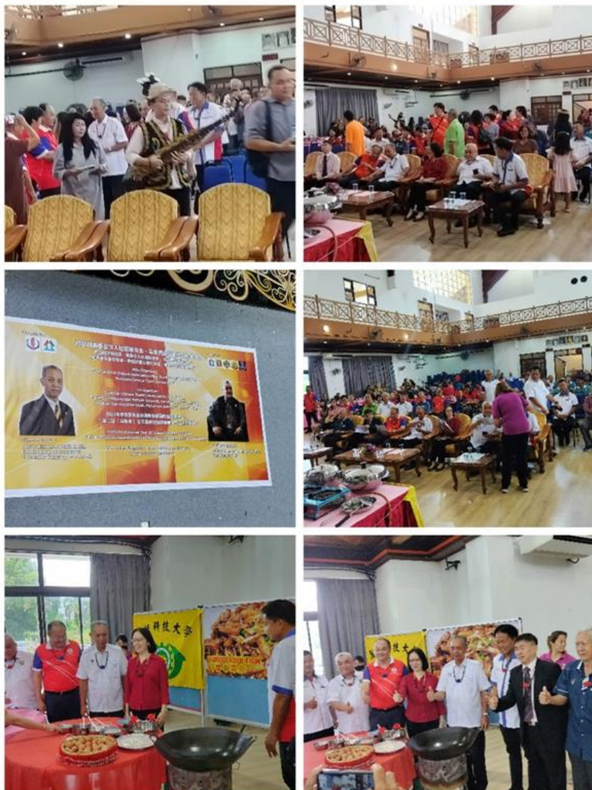
圖說：現場盛況及示範料理

教學菜單：千層紅玫瑰蛋糕 臺南棺材板 杏仁松鼠 福菜冬瓜封 海鮮佛跳牆 造型包子 芙蓉忘不了魚羹 創意獵人飯