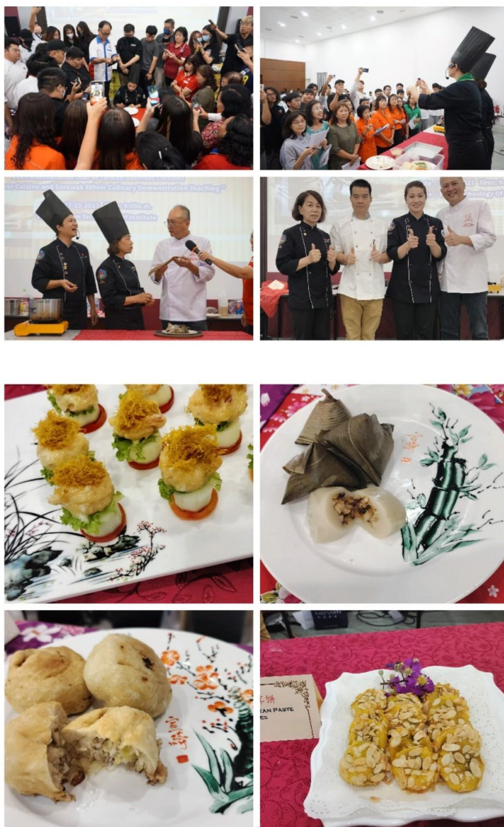
圖說：現場盛況及示範料理