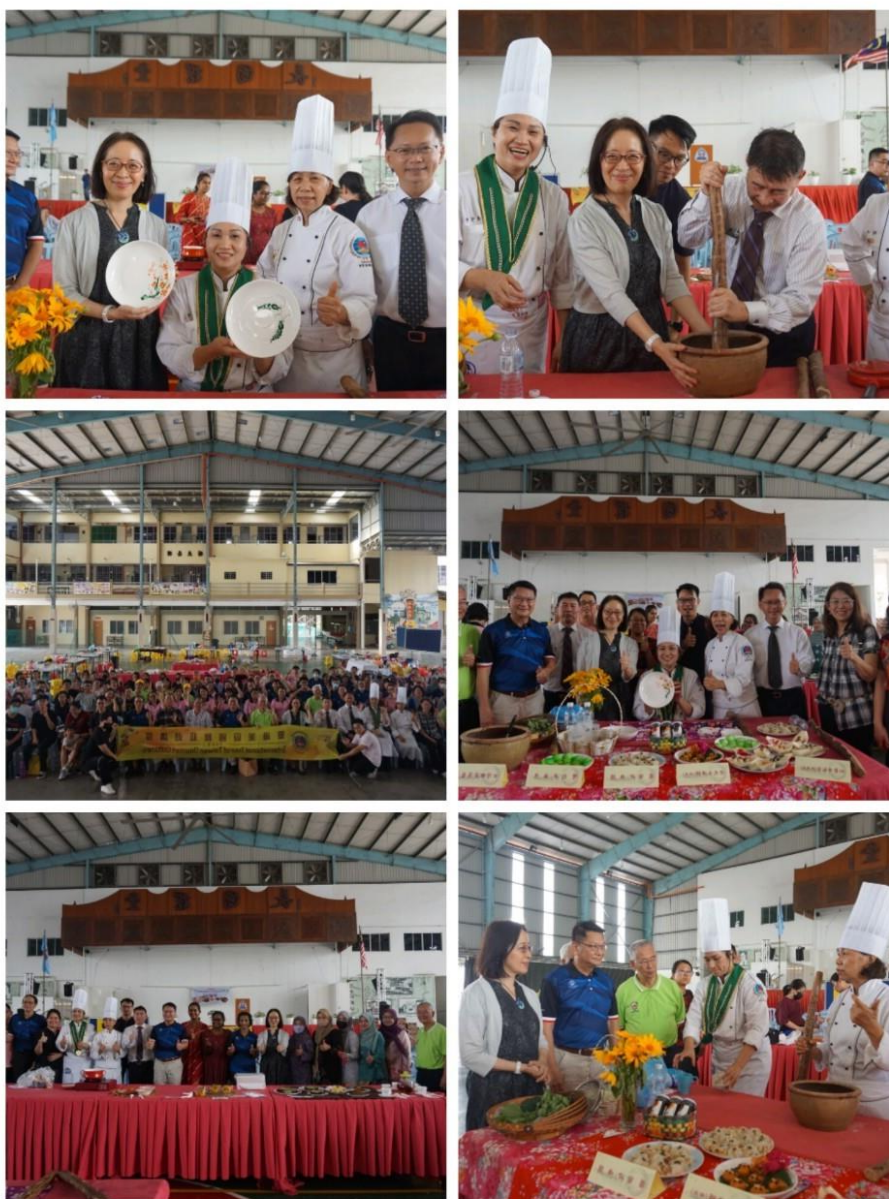
圖說：活動現場及示範料理