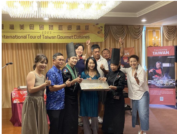
圖說：教學現場盛況