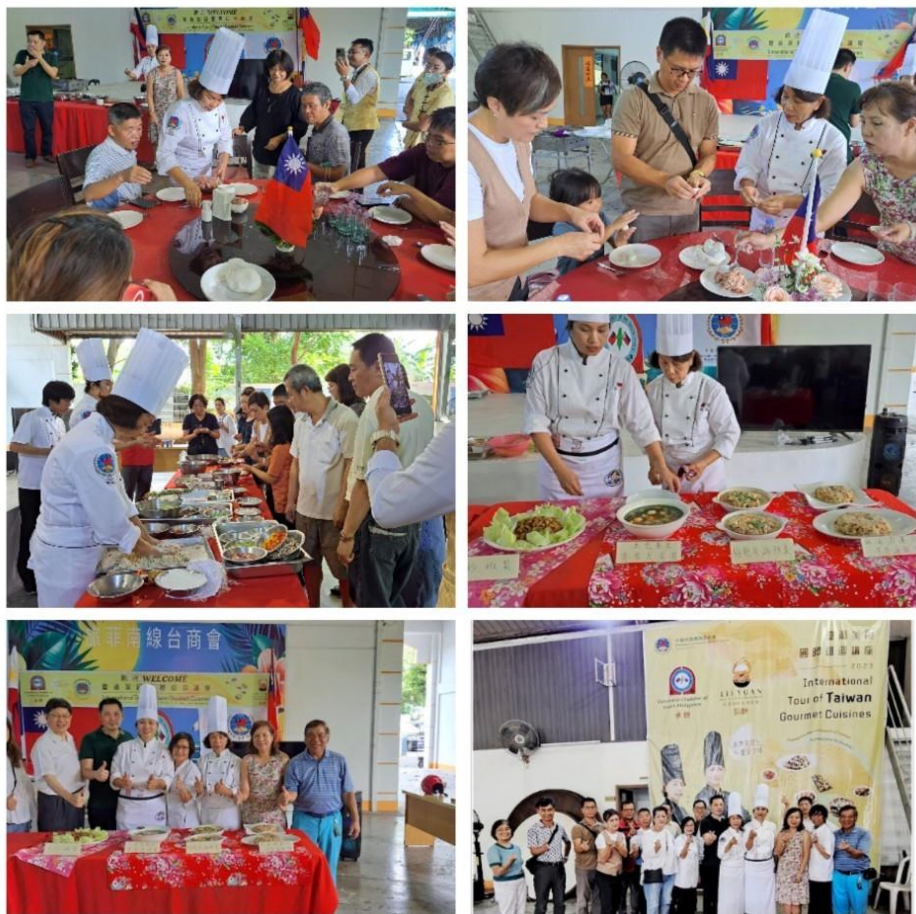
圖說：活動現場及示範料理