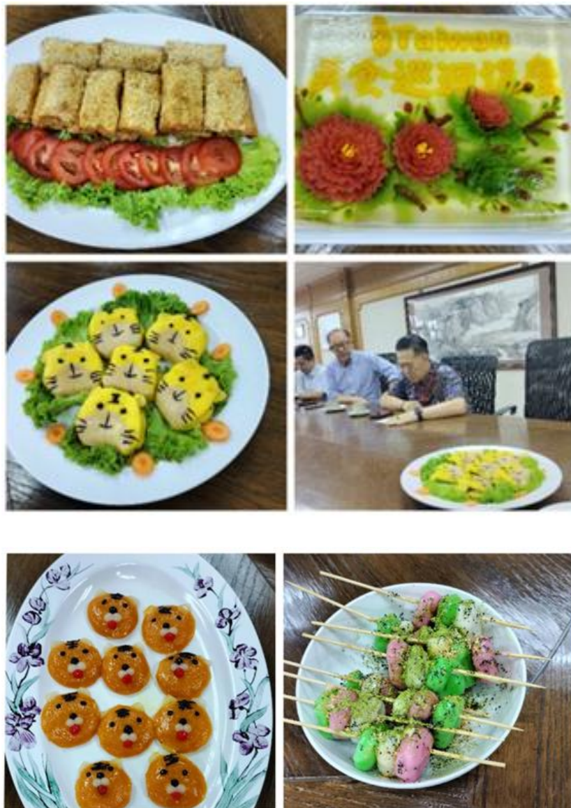
圖說：活動現場及示範料理