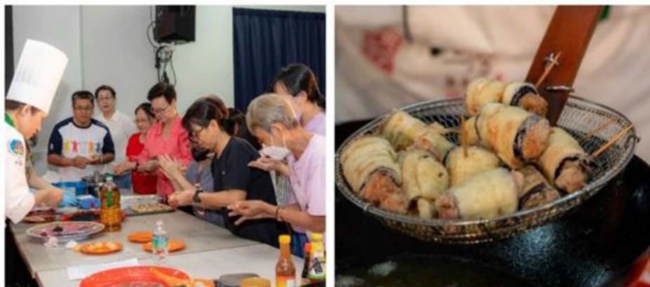
圖說：活動現場及示範料理