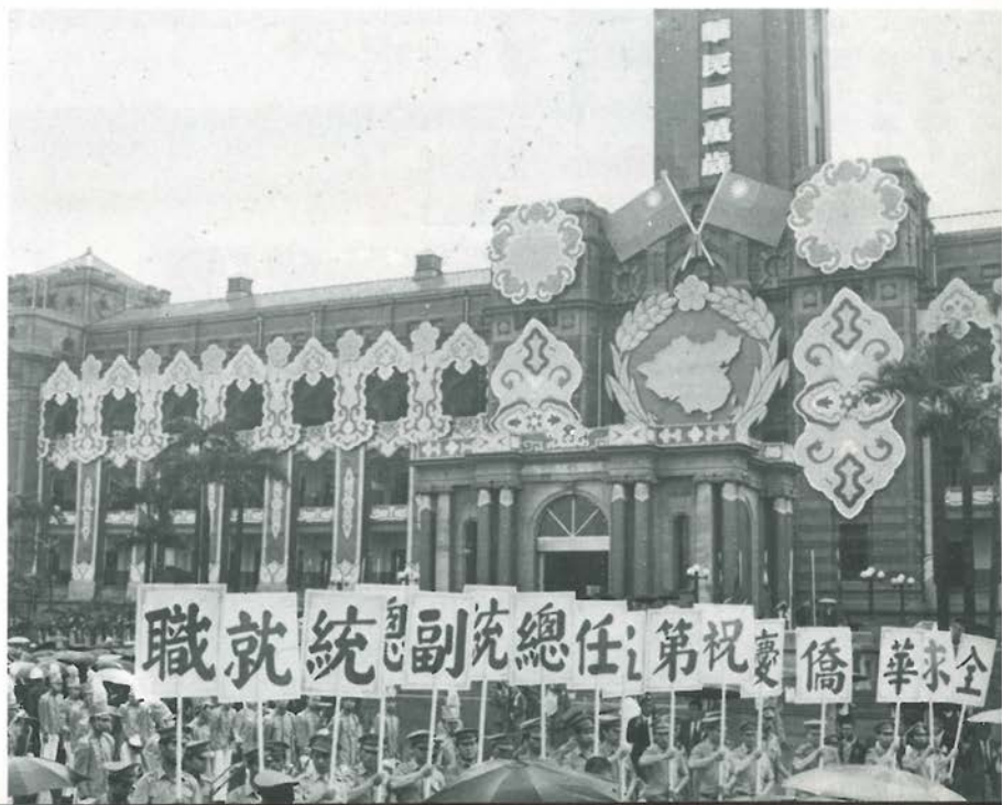
▲全球各地華僑回國慶賀總統、副總統就職。 ▲旅美國華盛頓州中華會館回國代表團參加慶祝總統、副總統就職大典遊行。