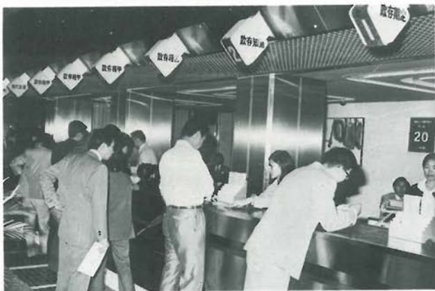
▶ 世界華商聯合銀行於中華民國六十四年五月二十日開幕。