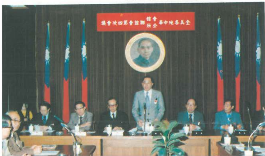
全美中華會館中華公所聯誼會於六十八年四月四日舉行第四次會議。