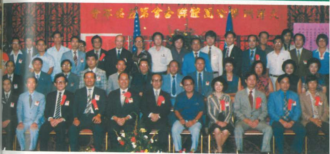
十三至九十二月五年十七於，議會次一第會誼聯所公、館會華中美全：上 ○影合員人席列出為圖，開召密阿邁在日 舉島關在日七廿至日五廿月八年十七於，議會合聯團僑屆五第洲洋大：下 ○影合員人議會席出為圖，行