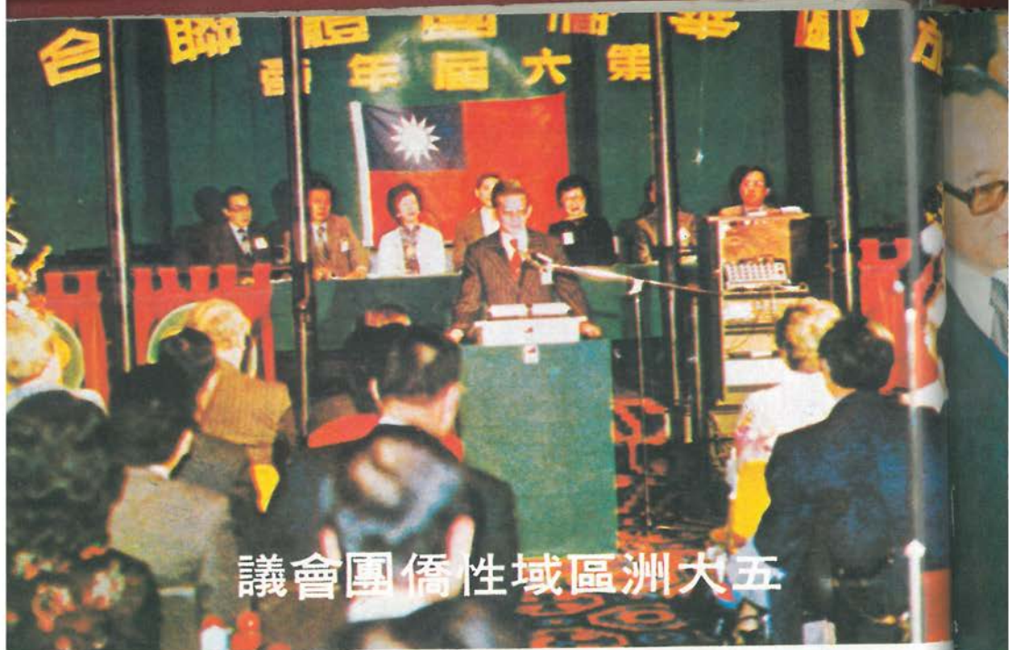
第五屆大洲區域性僑團會議