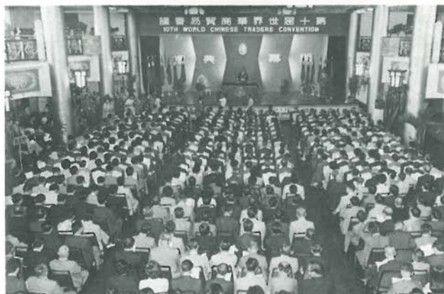
◀ 第十屆世界華商貿易會議於六十四年十月三日揭幕。