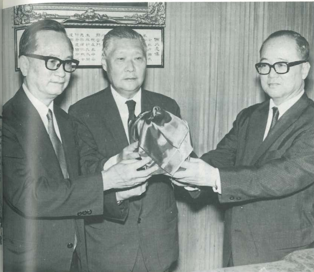
院政行，禮典接交長員委員會務僑任舊新 (日一月六年一十六)○交監超公葉員委務政