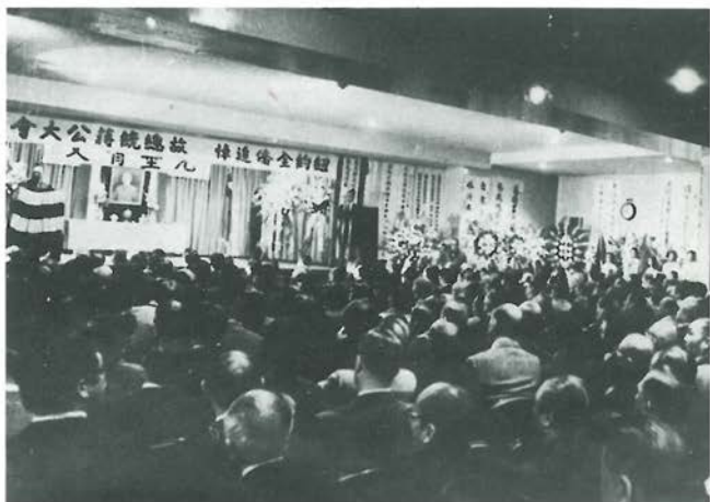
紐約全僑於六十四年五月七日在中華公所舉行追悼 蔣公大會。