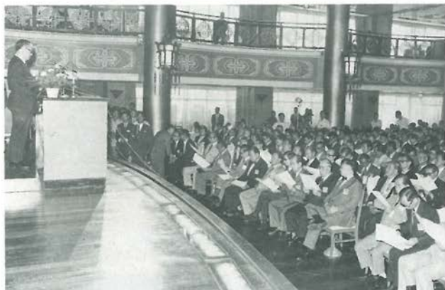
▶ 第九屆世界華商貿易會議於六十二年九月廿九日舉行。