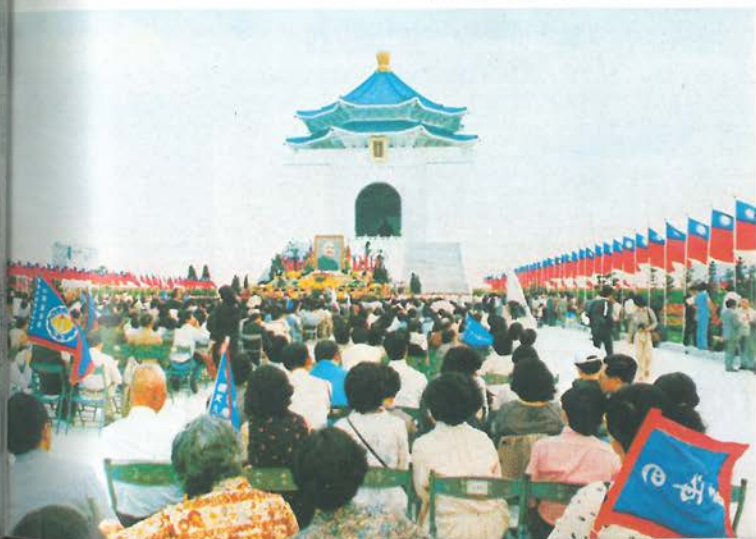
六十九年四月四日為中正紀念堂舉行落成大典並紀念 蔣公逝世五週年，海外僑胞代表數千人參加。