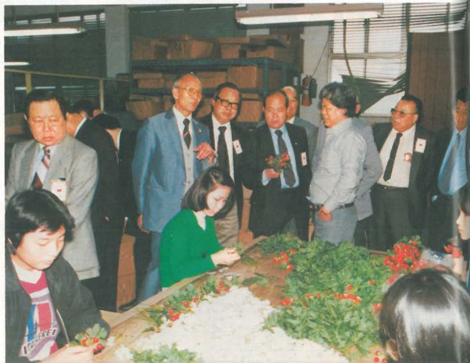
▲出席僑務委員會會議的委員參觀僑資工廠。 中華民國七十年十一月底舉行全體僑務委員會會議。