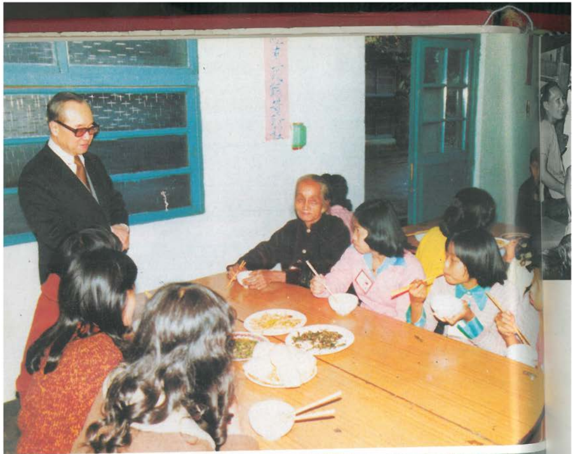
毛委員長松年慰問中南半島來臺的難僑。