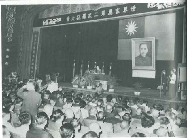
世界客屬懇親大會於中華民國六十二年二月五日召開。