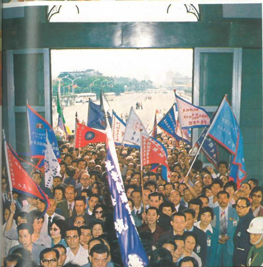
▲各地歸國僑胞六十七年五月參加慶祝第六任總統就職聯歡晚會，前往總統府簽名祝賀。 ◀歸國僑胞循序進入總統府簽名祝賀，表示對新元首的擁戴。