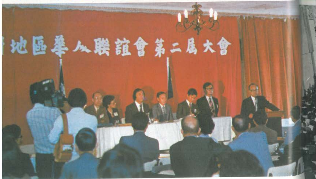
上：旅歐華僑團體聯合會第六屆年會，於中華民國九十六年四月廿一日