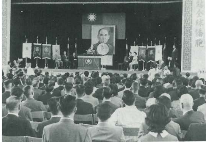
世界龍岡親義總會第四屆懇親代表大會開幕典禮