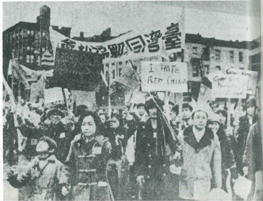
▶ 美東華僑六十八年元旦舉行示威遊行抗議美與中共建